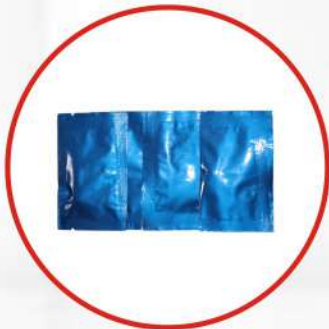
Dip Cup Tablets