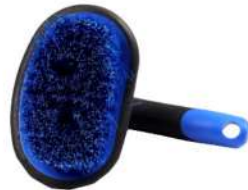
Can Wasing Brush