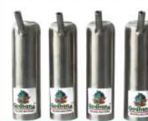
T Shell Assembly