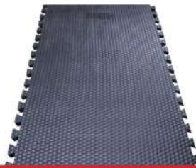
Cow Inter Lock Rubber Mats