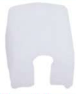
Small Sledge Fixing Block