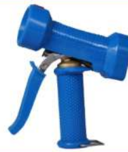
Power Sprayer Gun