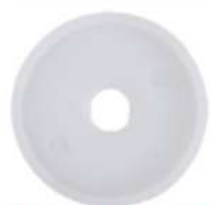
Pulsator Small Diaphragm