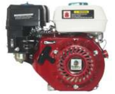
Petrol & Diesel Engine