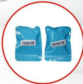
Chlorine Dioxide Tablets