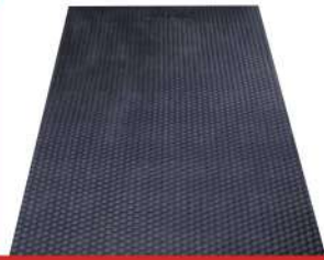
Cow Rubber Mats