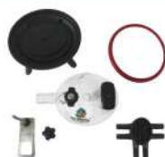
Milk Claw 240cc Parts