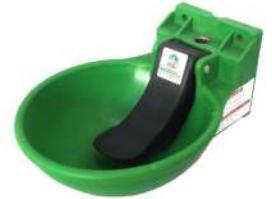
Water Bowl Plastic