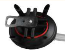
Milk Claw Bottom Bowl 240 Cc