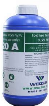
Povidone Iodine IP 5%