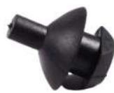
Vacuum Tank Rubber