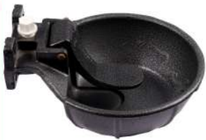
Water Bowl Casting