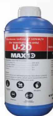
Povidone Iodine IP 10%