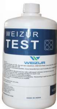
Godhan CMT Kit (Mastitis Testing)