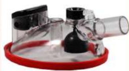
Milk Claw Upper Body Cap 240cc