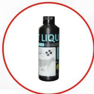
Mastitis Testing Liquid Kit