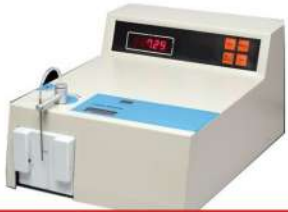
Milk Fat Testing Machine