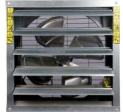
Dairy Fan Small