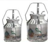
20 ltr can & 25 ltr can