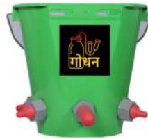
Feeding Bucket 6 Nipple Type