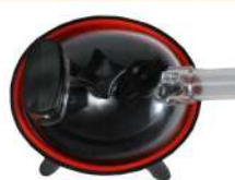
Milk Claw 240 Cc