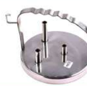
S S Can Lid