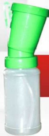
Teat Dip Cup