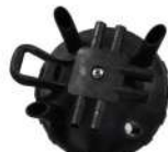
Milk Claw Back Cover