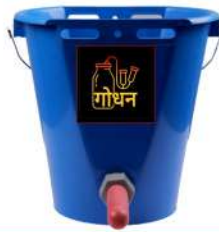
Feeding Bucket Single Nipple