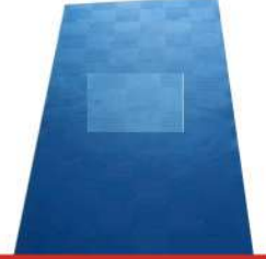
Cow Fom Mats