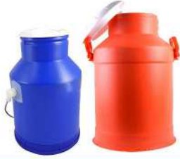
Plastic Milk Container